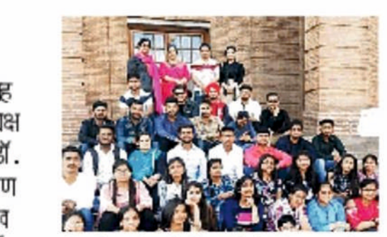
डीएवी कॉलेज के विद्यार्थी शैक्षणिक टूर के दौरान यादगारी तस्वीर खिंचवाते हुए।